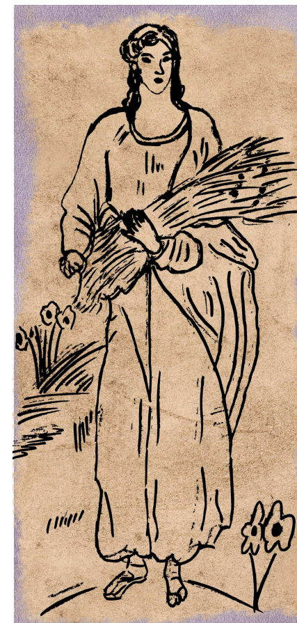
Ilustración Fabián Utrera